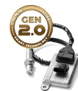
Sensori NO x di 2 a Generazione