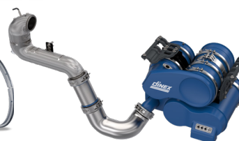
Soluzioni Euro 7